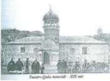
Şamaxı-Qala məscidi - XIX əsr

Haşiyə: vaxtilə Şamaxının iyirmi altı məhəlləsi (bəzi mənbələrdə 32 məhəllə) olmuşdur. Bu məhəllələrin bir neçəsində qeyri-müsəlmanlar yaşayırdılar.