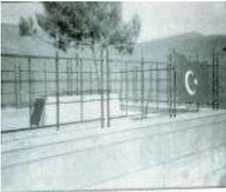
Şəhid türk zabiti - İzzət Əfəndinin məzarı (2000)

Bu qəbir osmanlı alayı qoşunlarından olan zabitin qəbridir. Qafqaza gəldi, müharibə etdi və şəhid oldu. 1336 (1918)-ci ildə şərəfli şəhadətli daddı, ilqarını seçdi.